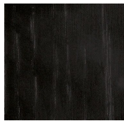
Nero poro aperto Black open pore