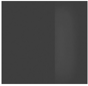
Cromo nero Black chrome