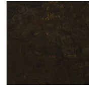
Metallo brunito a mano Hand burnished metal