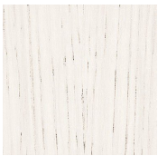
Bianco poro aperto White open pore